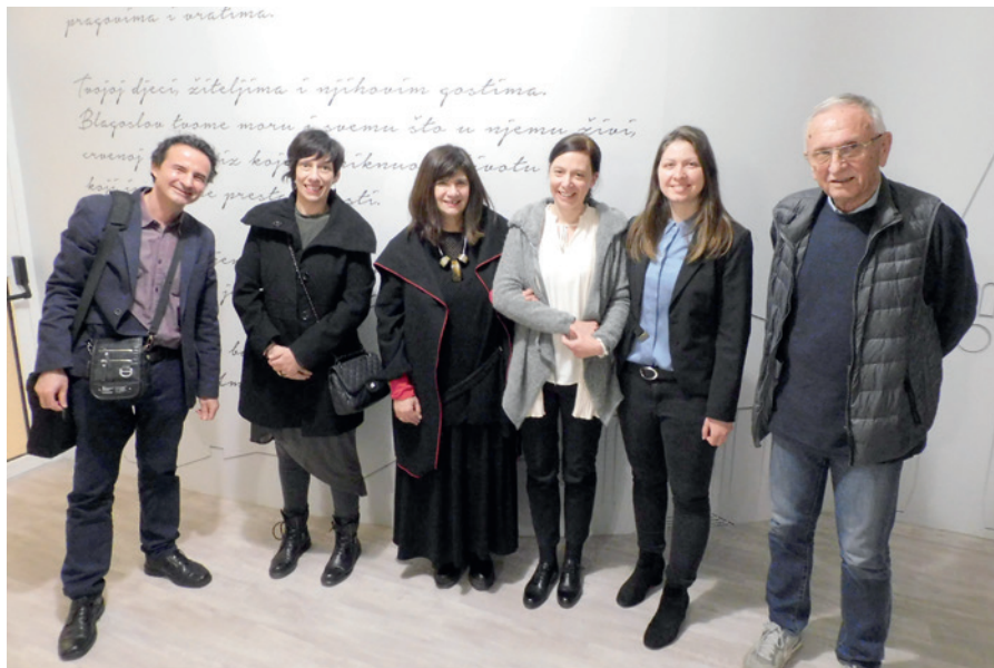
Julijana Matanović i Pavao Pavličić s ekipom GKU